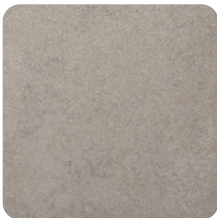
Jet de sable - Fleuri