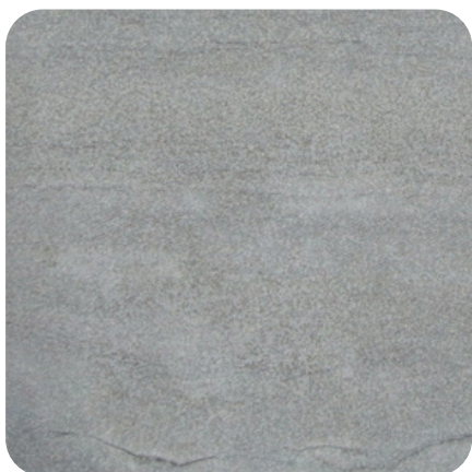
Jet de sable - Linéaire