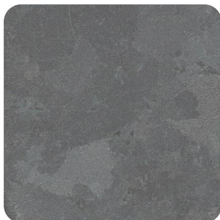
Jet de sable